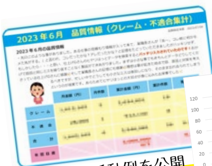
ひやりはつと活動例を公開