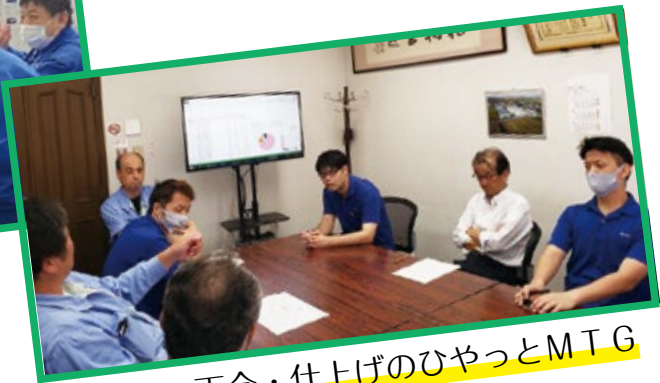
後加工・丁合・仕上げのひやりはつとMTG