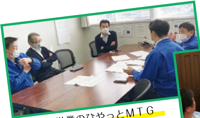
営業のひやりはつとMTG