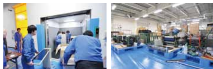
工場統合に伴う設備移動の様子