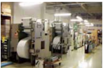
新工場内稼働状況