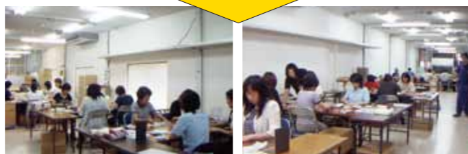
アッセンブリワークスペースとして再生