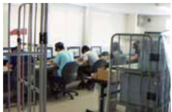
アッセンブリエリア